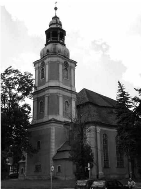
Kościół Zbawiciela w Jeleniej Górze-Cieplicach

Dom noblisty z 1912 r. Gerharta Hauptmanna , młodsze z braci, to prawie zamek, szary jak kamień. Nazwa