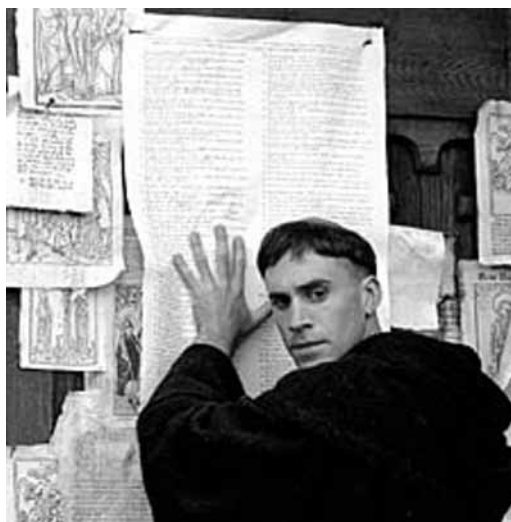
Marcin Luter przybija 95 tez na drzwiach kościoła w Wittenberdze

Okres jesienny jest w naszym kościele okresem wyjątkowym. Po pierwsze obchodzimy Pamiątkę Umarłych, a po drugie świętujemy dzień 31 października. Dlaczego? Otóż tego właśnie dnia w 1517 roku Marcin Luter przybił na drzwiach kościoła zamkowego w Wittenberdze 95 tez. Czy teraz pamiętacie już, co się wtedy tak ważnego dla nas wydarzyło? Jeśli nie, to poproście rodziców albo kogoś starszego o wytłumaczenie. Następnie rozwiążcie poniższe zagadki.