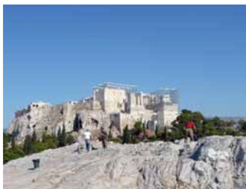
Widok z Areopagu na Ateny i obok na Akropol

KORYNT. Również to miasto znajdujemy na kartach Nowego Testamentu w Liście do Koryntian. Obecnie można zwiedzać ruiny starożytnego Koryntu, nieco jednak oddalone od współczesnego miasta. Największą atrakcją turystyczną jest widoczny nawet z samochodu Kanał Koryncki. Warto zatrzymać się choć na chwilę, zwłaszcza o zachodzie słońca. Dla śmiałków organizowane są skoki na bunge!