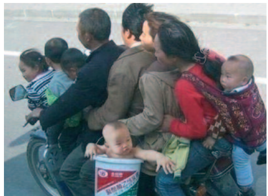
Jedziemy za miasto na grill