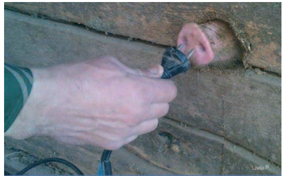
Alternatywne źródło energii

Przedszkolanka przechadzała się po sali obserwując rysujące dzieci. Od czasu do czasu zaglądała, jak idzie praca.