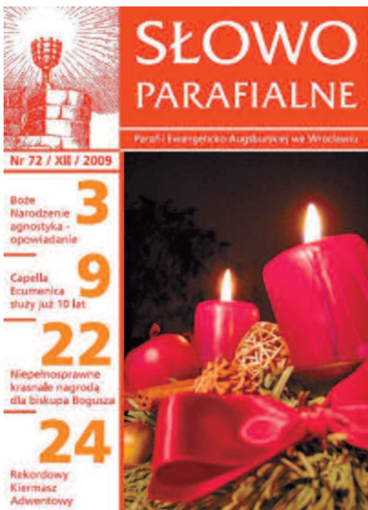
Słowo Parafialne - rok 2009