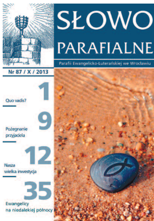
Słowo Parafialne - rok 2013

W imieniu swoim i parafian chcę z całego serca podziękować wszystkim, którzy przyczyniają się do tworzenia tych pięknych kart naszej historii.