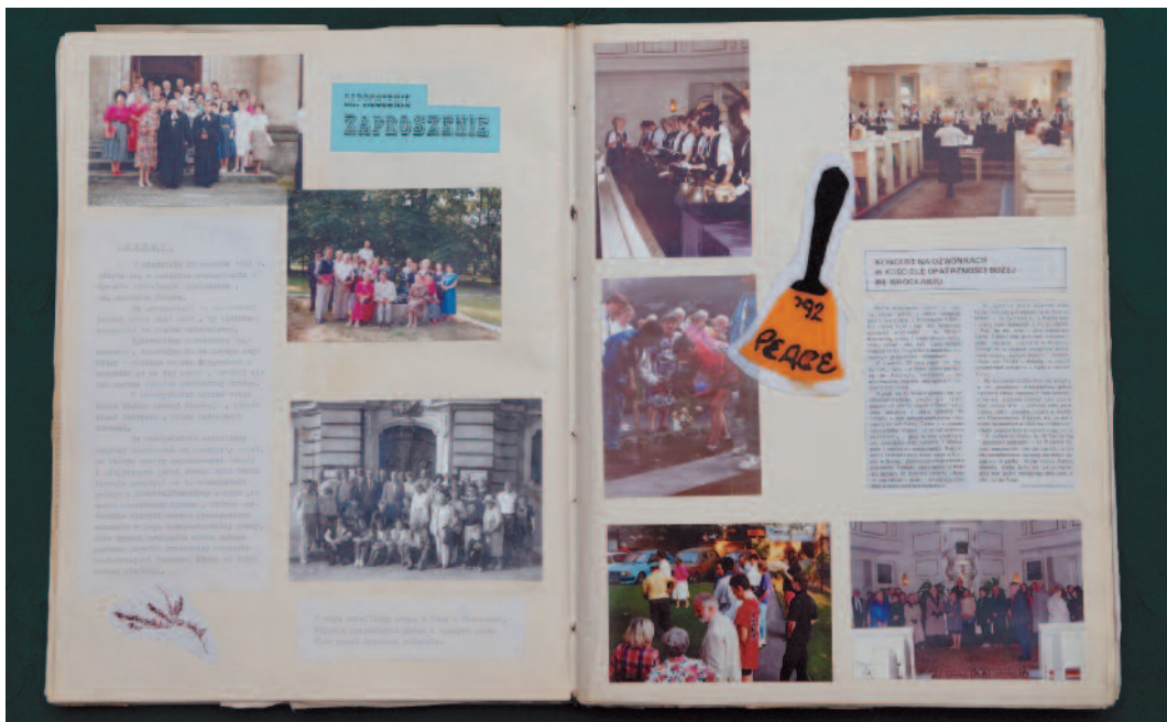
Kronika z życia parafii - „poprzedniczka” Słowa Parafialnego

Cofnijmy się wstecz o 70 lat. Powstała wtedy po prawie dwóch wiekach, po II wojnie światowej, w maju 1945 roku polska ewangelicka parafia we Wrocławiu. Prześledźmy kilka ważnych opublikowanych wydarzeń związanych z historią naszej parafii. Zawsze wzbudzały wśród parafian wielką radość, dumę i entuzjazm. Wiadomości przekazywaliśmy sobie ustnie po nabożeństwach, kilka z nich ukazało się w Zwiastunie. A były to „perełki” w których dowiadywaliśmy się o osiągnięciach naszych współwyznawców. Pierwszym opublikowanym artykułem, który ukazał się