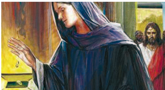
Jezus za wzór hojności przedstawił ubogą wdowę, która do świątynnej skarbonki wrzuciła zaledwie dwa grosze, ale była gotowa podzielić się wszystkim, co miała

- Twoja siostra zapłaciła. Zapłaciła cenę wyższą niż ktokolwiek inny: oddała wszystko, co posiadała.